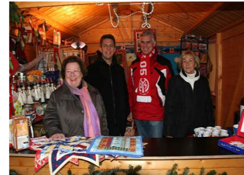
Zum ersten Mal nahmen wir am ersten Adventssonntag 2011 am Nieder-Olmer Weihnachtsmarkt teil