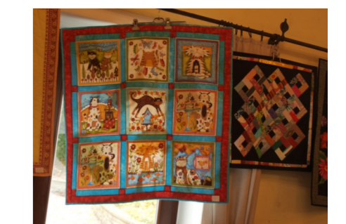
Unser Bücherflohmarkt wird unterstützt durch den „Töpferkreis im Camarahaushaus“ und Quilt-Kreationen von Edith Bäuerlein