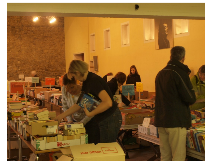
Bücherflohmarkt im November 2011. Ca 4.000 Bücher und Taschenbücher in allen Sparten bieten wir an