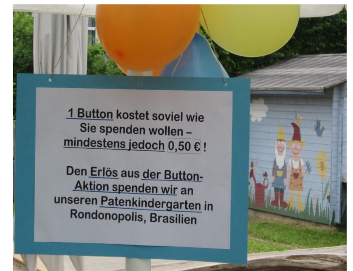
Zum 10-jährigen Bestehen der Kindertagesstätte Nierstein Roßberg-West fand ein Tag der offenen Tür statt, bei dem auch für deren Partnerkindergarten „Vila Operaria“ gesammelt wurde.