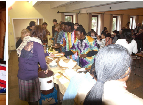
Das Fastenessen am ersten Fastensonntag 2012 wurde gut angenommen. Der Erlös kam unserem Afrikaprojekt in Mwabo zugute