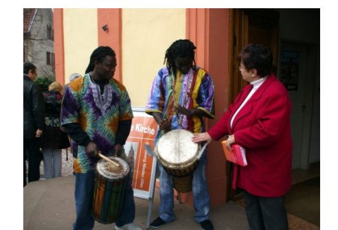
Eine afrikanische Trommlergruppe umrahmte unseren Gottesdienst und die Feierstunde zur Eröffnung unseres Afrikaprojektes am 26.02.2012