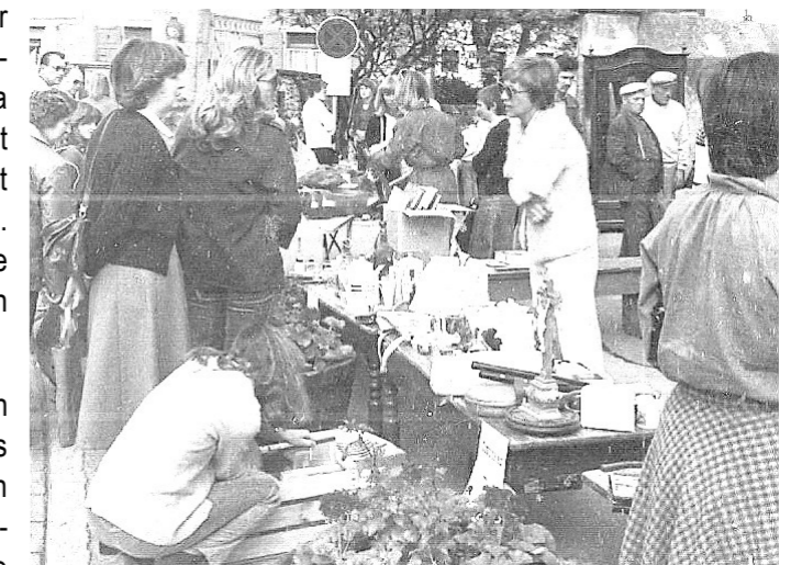
1975: Camarakreis veranstaltet den „Ersten Nieder-Olmer Flohmarkt“