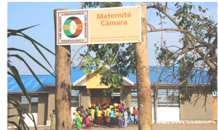
Plakette am Eingang zur neuen «Maternité Câmara»

Kongo ist eines der Probleme dieses Landes. Für uns im Jeep sitzend, der von einem hervorragenden Fahrer gesteuert wird, ist das zwar anstrengend aber nicht problematisch.