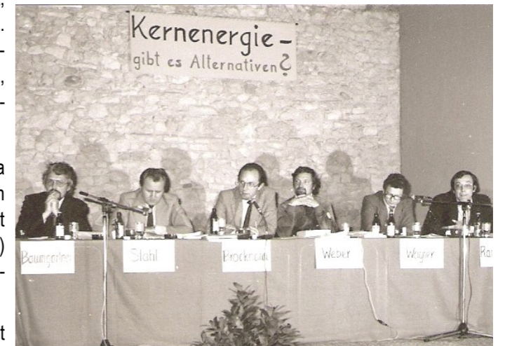
Diskussionstag 1979: „Kernenergie, gibt es Alternativen?“